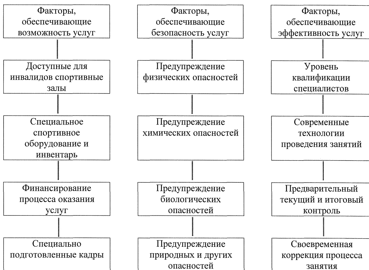
Рисунок 1. Факторы, влияющие на доступность услуг для инвалидов и других маломобильных групп населения на объектах спорта и в учреждениях и организациях, предоставляющих услуги

Понятно, что для обеспечения возможности предоставления и получения услуг для инвалидов и МГН необходимо наличие кадров, имеющих право работать с данным контингентом.